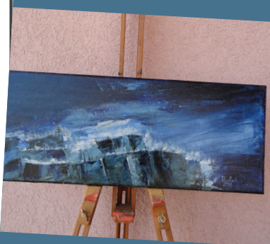
Acrilico su tela "Blue Nightmare" produzione 2010 Autore: Paola Ghedini (Lugano)