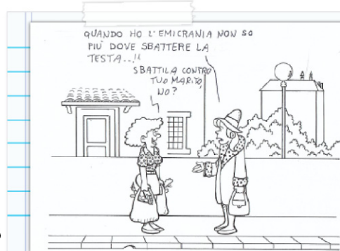
Vignetta di M Fusi