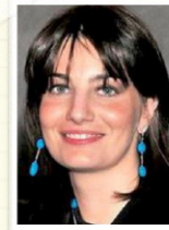
Lara Comi, Parlamentare Europeo

Mi preme ricordare al proposito che l'ottavo programma quadro della ricerca (che